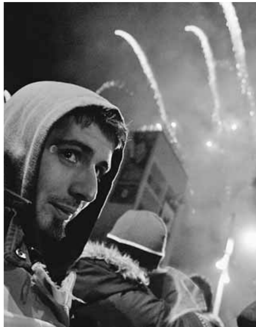
Косовские албанцы ликут.