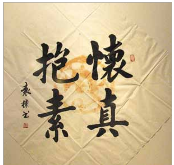
ЮАНЬ ПУ Каліграфічна композиція Китай