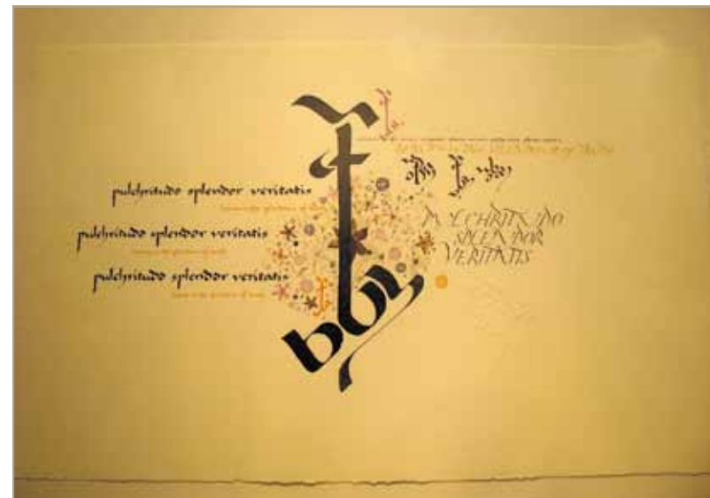
МІТЧЕЛЛ ДЖАНІН Каліграфічна композиція Австралія