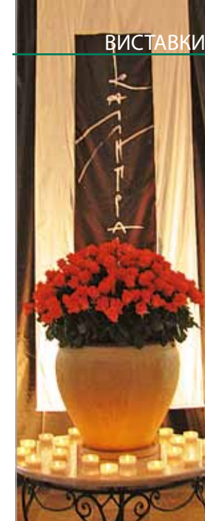
ВАСИЛЬ ЧЕБАНИК Шрифтові композиції Україна