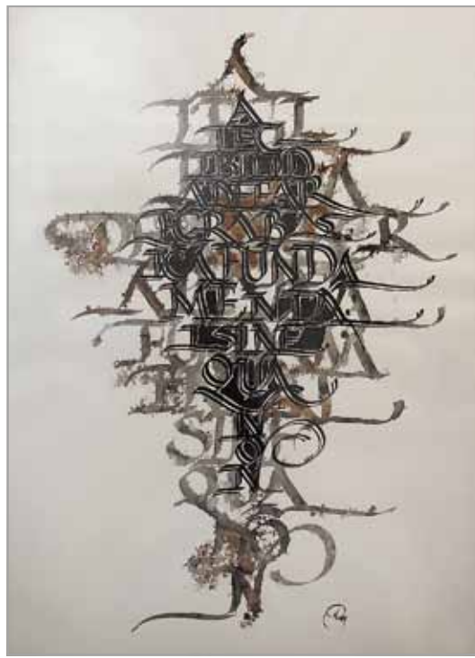
ШАН ШАН ШЕНГ Каліграфічна композиція Китай