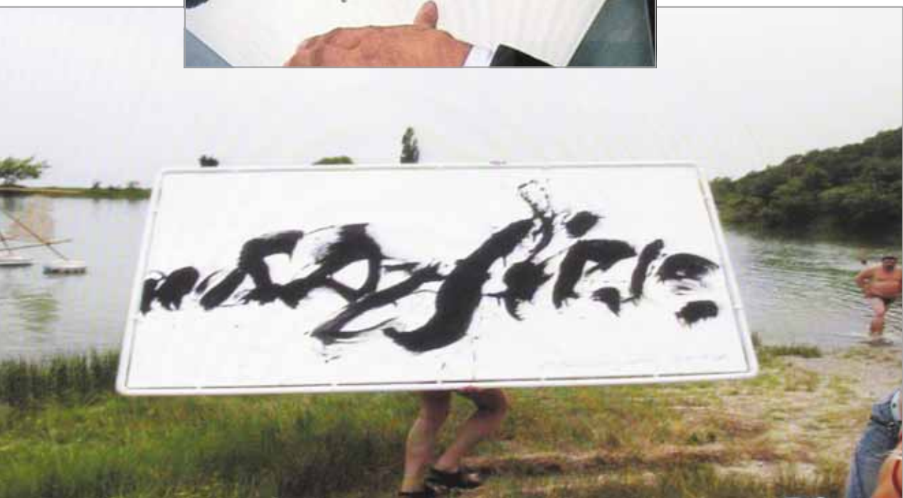
ДЖИЛ КЛАУДІО Каліграфічна композиція Бразилія